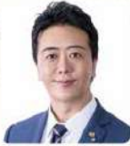
福岡市民の祭り振興会 名誉会長 高島 宗一郎 (福岡市長)