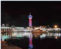
美しい夕暮れや夜景を見渡せる 博多ポートタワー